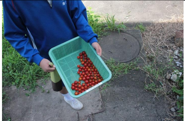
甘いミニトマトが取れました。