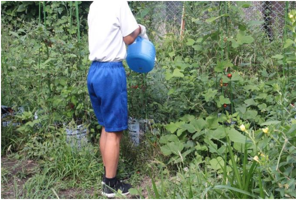
ミニトマトは袋栽培にて育成