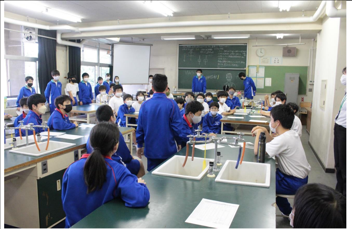
最初の自己紹介の様子

部活動見学・仮入部を経て4月27日から本入部となりました。最初は顔合わせということで、自己紹介からスタートし、部活の活動内容を確認しました。