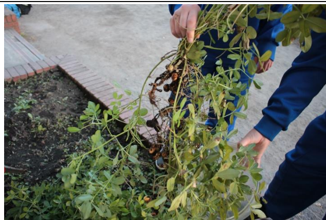
落花生収穫の様子①