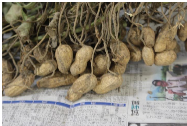
落花生収穫の様子③