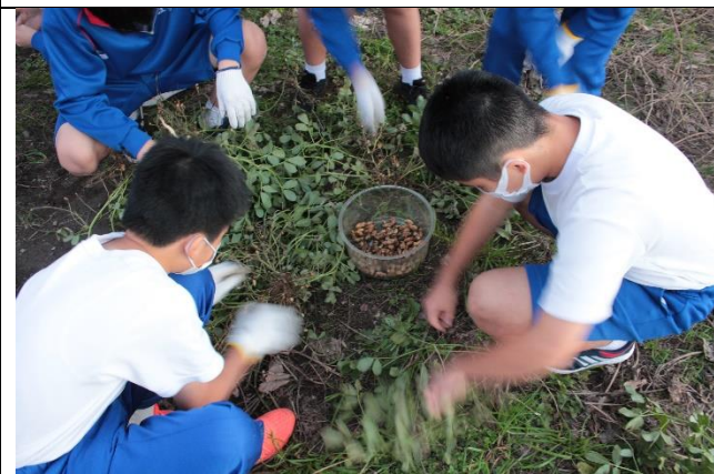
落花生収穫の様子②。