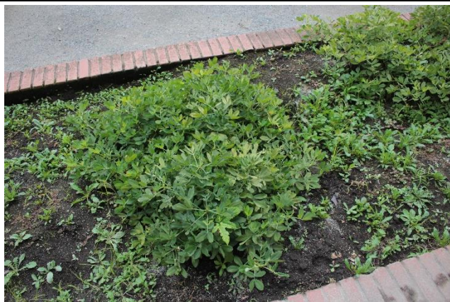
校庭近くの畑の様子。(落花生)