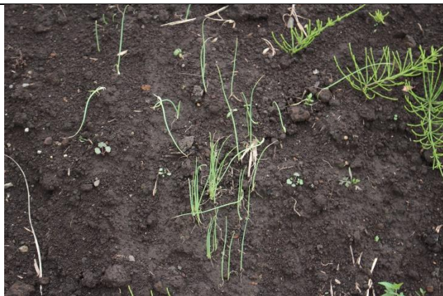
玉ねぎが生えてきました。