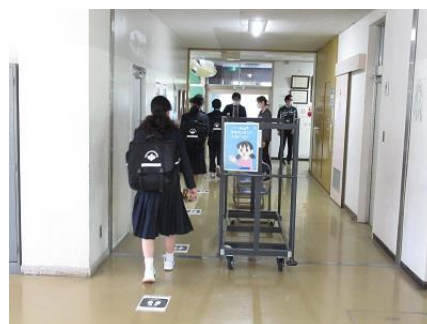
接触を避けるため校内は一方通行