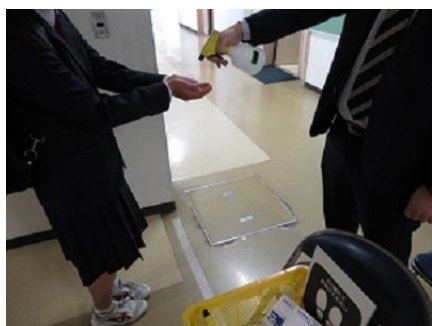
アルコール消毒をして教室へ

なお、次に登校していただく5月21日（木）は、4月に課した課題のフィートバックを行う予定です。