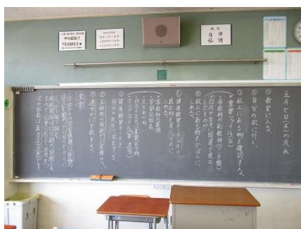
黒板で本日の流れを確認