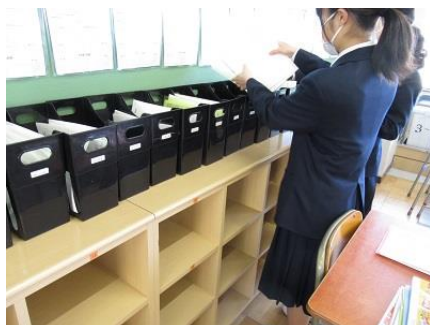
指定された場所に課題を提出