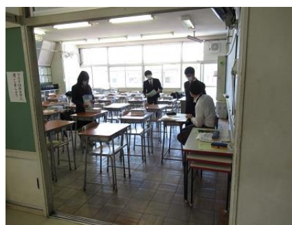
配布物の受け取り