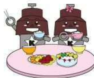
川口市マスコット「きゅぽらん」