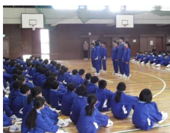
生徒会本部の説明